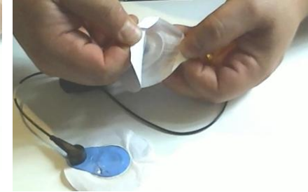
Enlever la protection de l'autocollant de chaque électrode