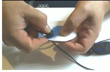
Clipper la deuxième électrode neuve