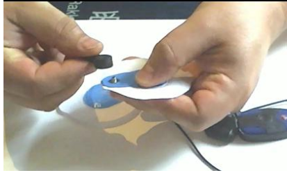
Clipper la première électrode neuve