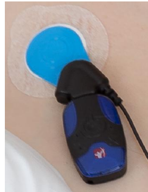
Appuyer sur le bouton du capteur pour la mise en marche avant de se coucher, l'appareil clignote durant l'enregistrement.